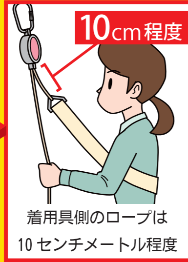
10cm程度 着用具側のロープは 10センチメートル程度