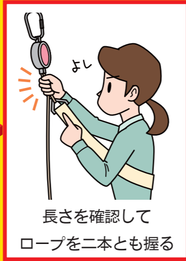
よし 長さを確認して ロープを二本とも握る