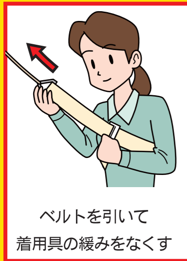
ベルトを引いて 着用具の緩みをなくす